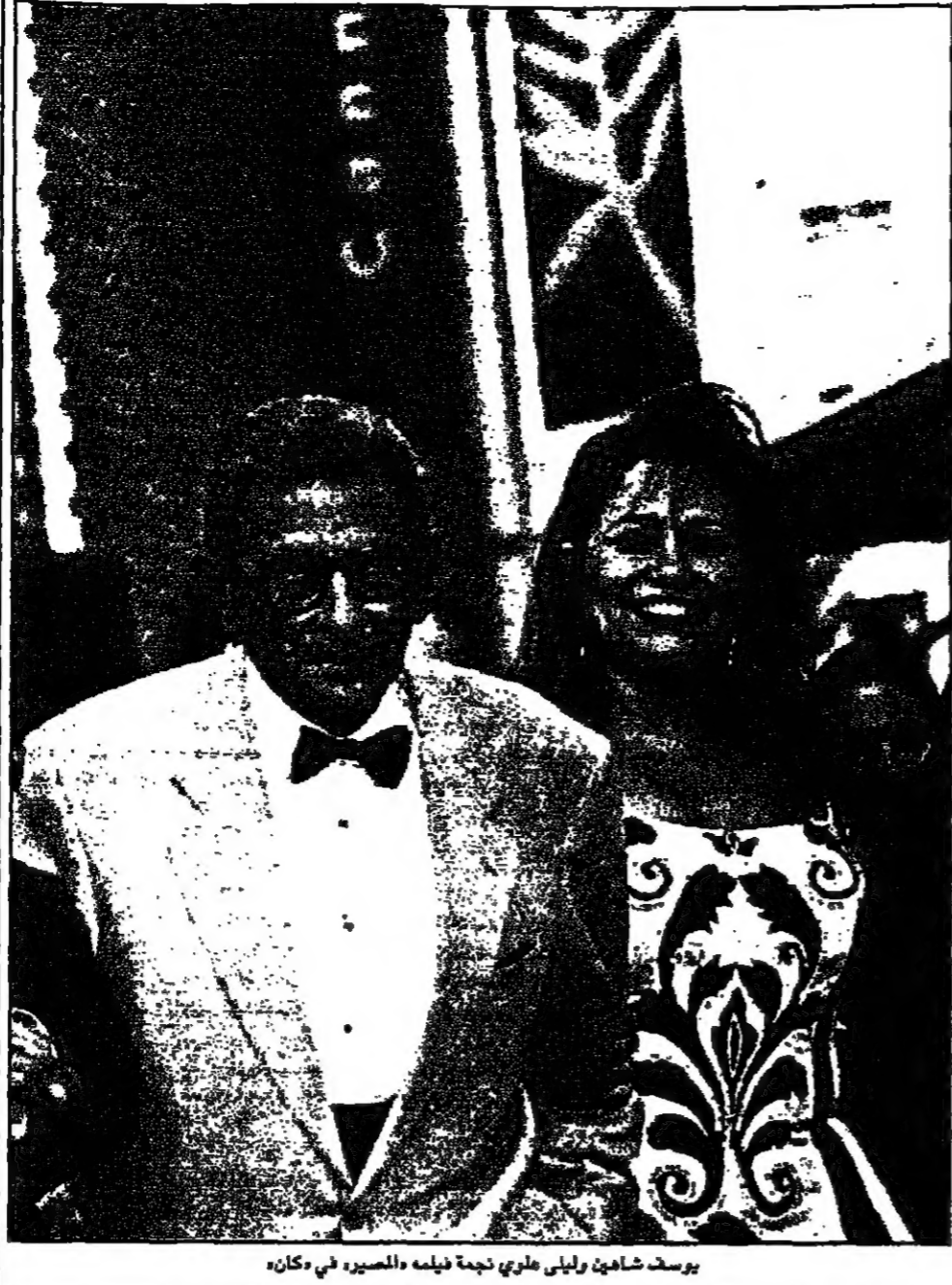
يوسف شاهين وأولاد علي نجمه فيلمه «المصري» في كان